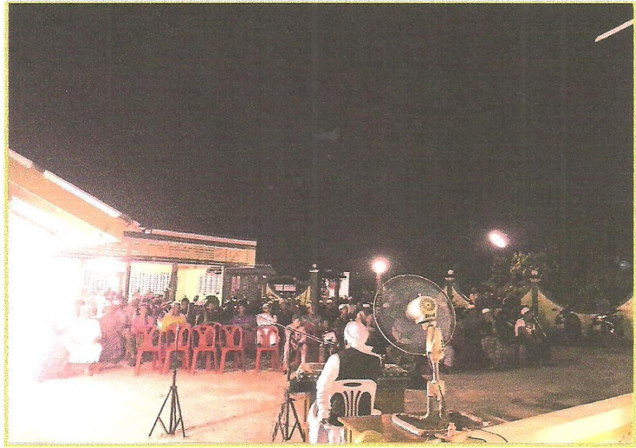
มีวิทยากรมาบรรยายให้ความรู้