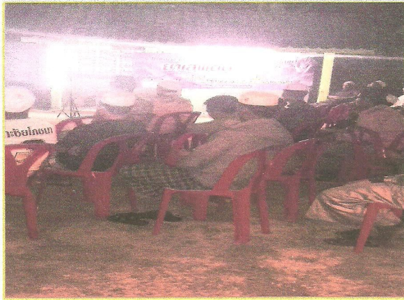
เยาวชน ประชาชนในพื้นที่ให้ความร่วมมือในการเข้าร่วมกิจกรรม

ณ มัสยิดอีบาดุลเราะห์มาน หมู่ที่ ๕ ตำบลตะบึง อำเภอสายบุรี จังหวัดปัตตานี