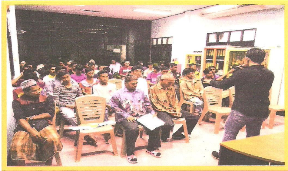
ผู้บริหารมาให้ความรู้แก่กลุ่มเยาวชนตำบลตะบิ้ง

ภาพประกอบการจัดโครงการพัฒนาศักยภาพกลุ่มเด็กและเยาวชนตำบลตะบิ้ง ประจำปีงบประมาณ ๒๕๖๓ ระหว่างวันที่ ๒๘ ถึงวันที่ ๒๙ เดือน พฤศจิกายน พ.ศ. ๒๕๖๒ ณ ห้องประชุมองค์การบริหารส่วนตำบลตะบิ้ง อำเภอสายบุรี จังหวัดปัตตานี