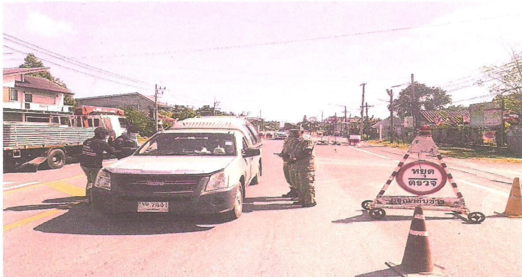
สมาชิก อปพร.อบต.ตะบึง และทหารร่วมกันปฏิบัติหน้าที่