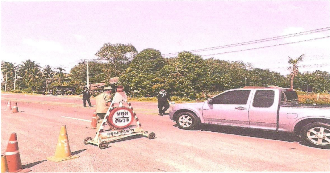
สมาชิก อปพร.อบต.ตะบิ้ง และทหารร่วมกันปฏิบัติหน้าที่