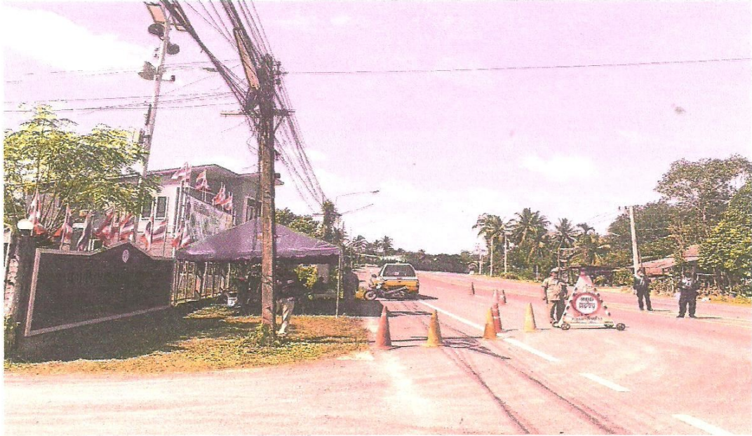
สมาชิก อปพร.อบต.ตะบึง และทหารร่วมกันปฏิบัติหน้าที่

ระหว่างวันที่ ๒๗ เดือน ธันวาคม ๒๕๖๒ ถึงวันที่ ๒ เดือน มกราคม พ.ศ. ๒๕๖๓ ณ ด้านตรวจหน้าทำการองค์การบริหารส่วนตำบลตะบึง อำเภอสายบุรี จังหวัดปัตตานี