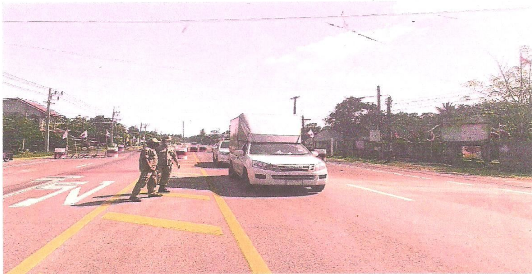
สมาชิก อปพร.อบต.ตะบิ้ง และทหารร่วมกันปฏิบัติหน้าที่